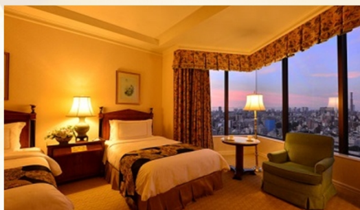
スーペリアルーム